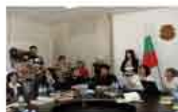
Кръгла маса на тема: „Чрез информираност срещу наркотиците“ - Видин