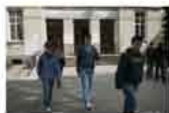
Информационна кампания "Мисли за здравето си - не за наркотици" - Велико Търново