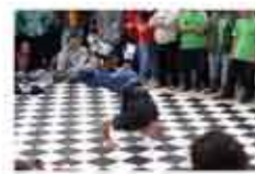
Хип-хоп фестивал и конкурс под мотото "Вдигни очи, виж този свят" - Враца