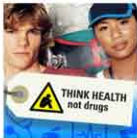
Форум на тема „Младите хора срещу наркотиците“ във Варна