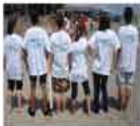
"Спорт срещу дрога" - спортен празник в Бургас