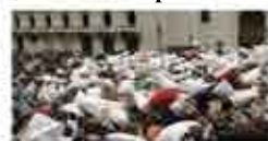
„Стани точно ти организаторът“: „Масова Битка с Възглавници“ под мотото „Не на заобикалящите ни наркотици и насилие!“