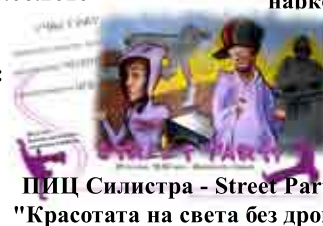
ПИЦ Силистра - Street Party "Красотата на света без дрога"