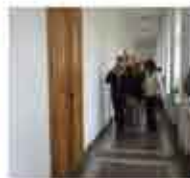
Мобилна информационна кампания, реализирана в няколко училища в Хасково