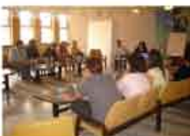
Кръгла маса с младежи и техните родители - ОбСНВ - Кърджали