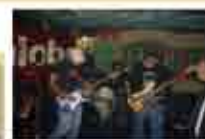
Рок концерт "Не на наркотиците - Да на живота" - Добрич